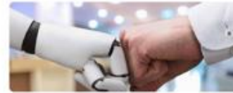
Anders Werken in de Zorg

11 mei 2022 Tien ouderenzorgorganisaties in Zeeland zien het belang van samenwerking. Zorginnovatie krijgt pas echt kracht met een gezamenlijke aanpak. In het programma Anders werken in de Zorg Zeeland geeft een technologische innovatie de noodzakelijke versnelling met inzet van nieuwe technologie en implementatiebegeleiding door zorgverlener.